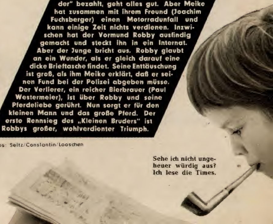
Sehe ich nicht ungeheuer würdig aus? Ich lese die Times.